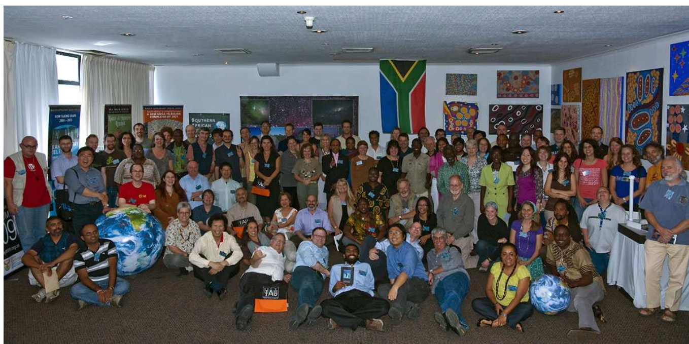
Teilnehmer der Konferenz in Kapstadt.